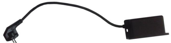
1 무선 AP